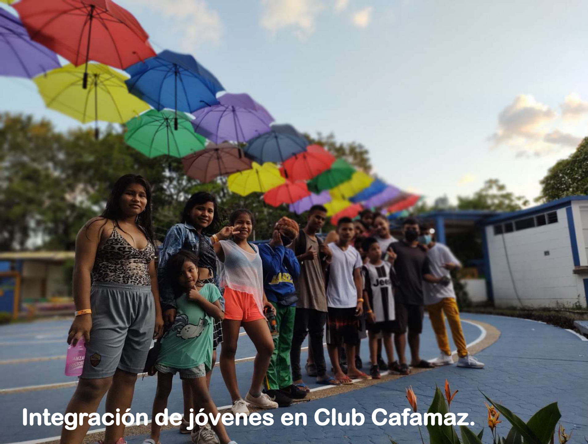
Integración de jóvenes en Club Cafamaz.